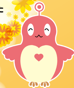
仙台市障害理解促進キャラクター 「ココロン」