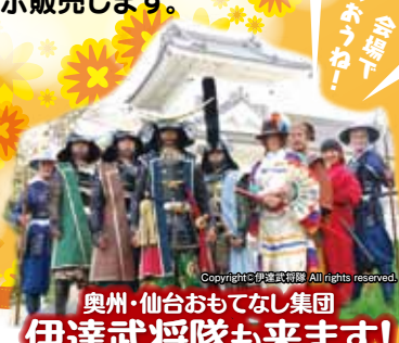
奥州・仙台おもてなし集団 伊達武将隊も来ます!